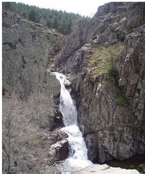
Cascada alta de las dos principales