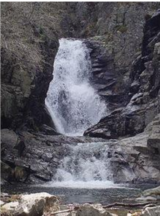
Cascada baja de las dos principales.

que supera una barrera rocosa. Hay dos saltos principales: la cascada Baja, un salto de agua muy vertical de una altura de 10 metros y situada a una altitud de 1.350 msnm y, a unos 200 metros aguas arriba, la cascada Alta. Este segundo salto es de 15 metros y más encajonado. Para llegar a ellas la ruta normal parte del Puente del Perdón en Rascafría, sin embargo nosotros lo haremos en sentido contrario dirección norte ya que venimos del Puerto de la Morcuera.