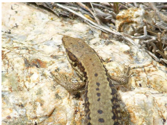
Lagartija roquera (Podarcis muralis)

Por debajo de los pinares (a una altitud menor de 1.400 m), el piso montano está cubierto por robledales de rebollo ( Quercus pyrenaica L), que en ocasiones se mezclan con el pinar.