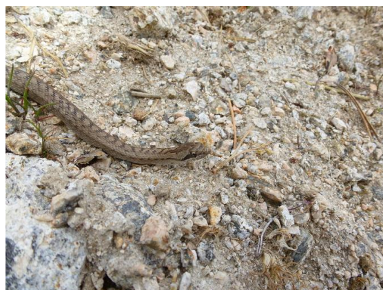
Culebra de herradura (Hemorrhois hippocrepis)

Es de destacar la presencia de un endemismo mundial, el Geranio de El Paular Erodium paularense .