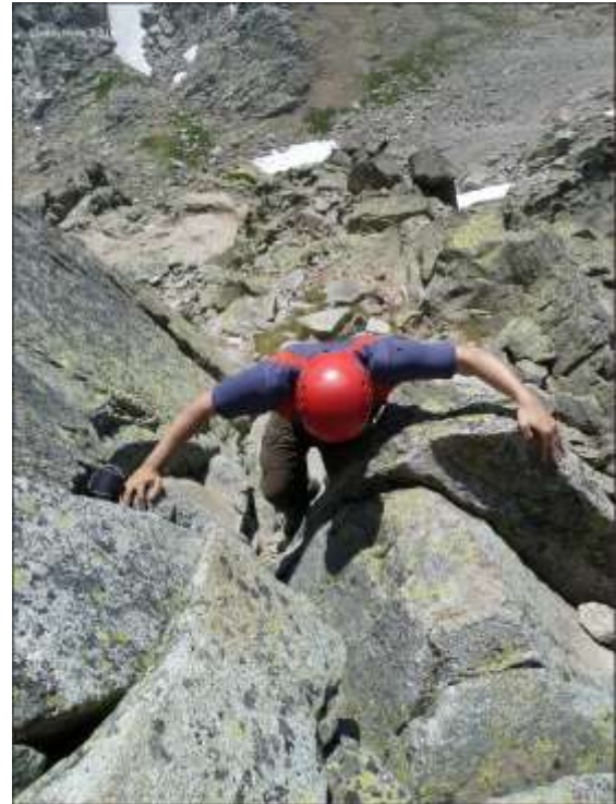
La Galana Pasos II+ una trepada aérea entre bloques graníticos.