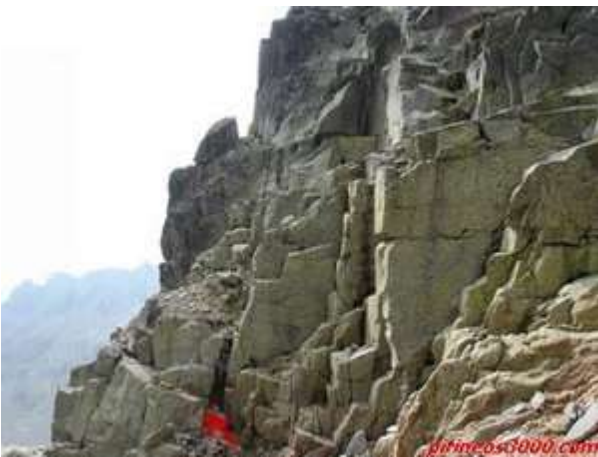
Primeras placas del ascenso