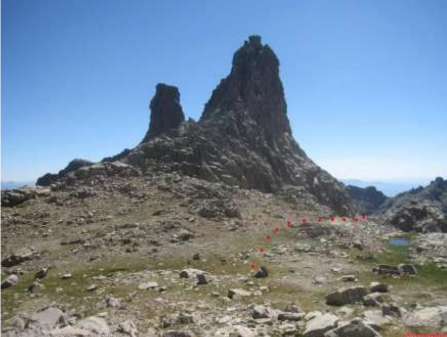
Ameal desde la pradera base y charca cercana