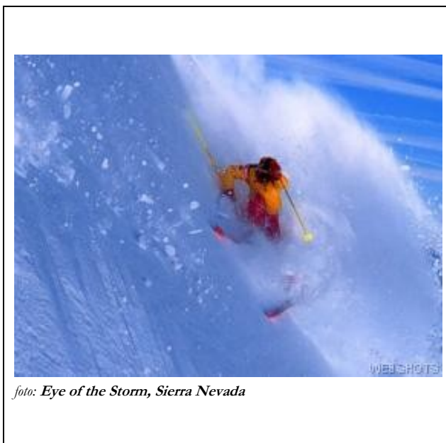
foto: Eye of the Storm, Sierra Nevada