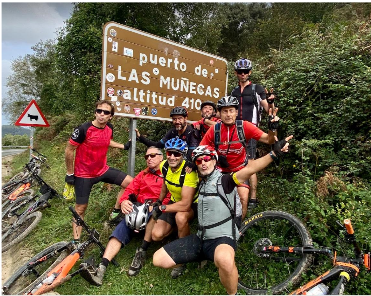
Última cerveza con este fantástico grupo de gente con ganas de disfrutar de la bici y del buen ambiente. ¡Planazo de puente!"