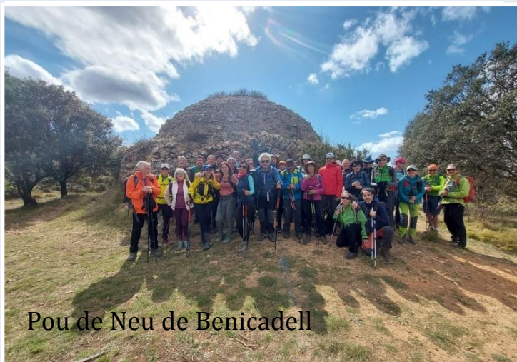
Pou de Neu de Benicadell