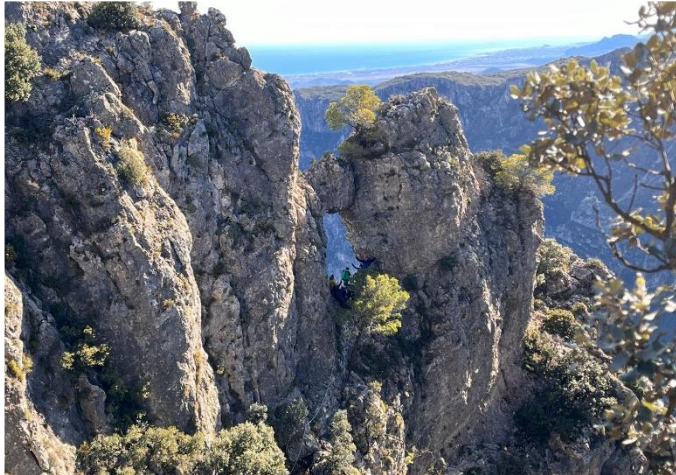
Finestra de La Safor

Posteriormente, tras las fotos de rigor, bajamos por un lapiaz hasta adentrarnos en un bosque dónde no resulta tan fácil seguir el track de la ruta. La experiencia del grupo ayuda a que todo transcurra de la mejor manera y pronto salimos del atolladero.