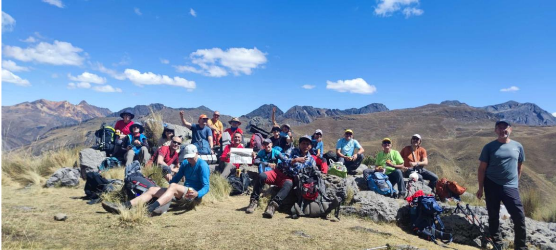
El día transcurre con unas vistas incomparables del valle