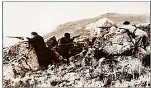
Guerra civil en la sierra.

También en la guerra civil española (siglo XX) fue la sierra de Guadarrama un importante frente de batalla que se mantuvo durante casi toda la contienda, como muestran las trincheras y casamatas que aún se conservan a lo largo de la línea de cumbres.