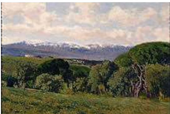
El Guadarrama desde el Plantío de los Infantes Pintura de Aureliano de Beruete (1910)

Gracias a las influencias de Centroeuropa, a partir de mediados del siglo XIX se empezaron realizar en esta sierra actividades de conocimiento y exploración del medio natural y valorar sus recursos naturales, no solo desde un punto de vista económico y científico sino también como recurso educativo y de esparcimiento para los habitantes de la ciudad especialmente.