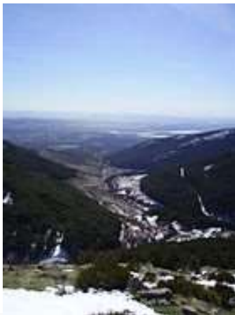
Hueco de San Blas Vista desde una zona alta del mismo

El valle se orienta de noroeste a sureste adaptado a una fractura de dirección norte noroeste-sur sureste, tiene una longitud aproximada de 5 km y en el fondo del mismo está el arroyo del Mediano, un afluente del río Manzanares. La máxima altitud del valle está en la cima de Asómate de Hoyos (2242 m), que está en el extremo noroeste del paraje, y la zona más baja está en el entorno de los 1000 metros. Muy cerca de esta cumbre hay un pequeño circo glaciar llamado Hoyo Cerrado, uno de los pocos que hay en la vertiente meridional de Cuerda Larga. Un poco por encima de él nace el arroyo del Mediano.