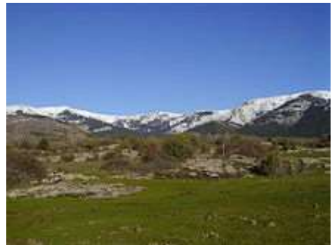
Hueco de San Blas visto desde la zona más baja.

El Hueco de San Blas , también conocido como Hoya de San Blas , es un valle de montaña situado en la cara sur de la zona central de la sierra de Guadarrama (perteneciente al sistema Central). Este enclave natural se sitúa en los términos municipales de Manzanares el Real y de Soto del Real, en el noroeste de la Comunidad de Madrid (España). Este valle está encajonado entre La Pedriza, que queda al oeste, la línea de cumbres de Cuerda Larga, que hace de límite septentrional, y la montaña de La Najarra, que es la montaña más oriental del citado cordal de montañas.