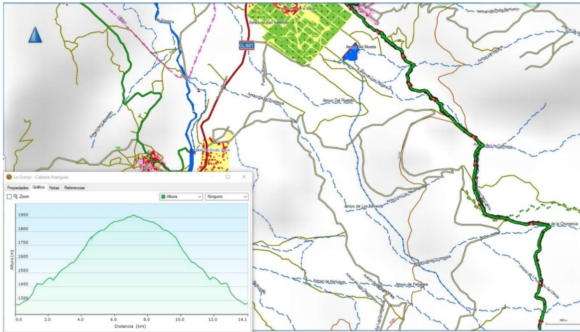
Mapa con la traza del tracks a seguir en la ruta