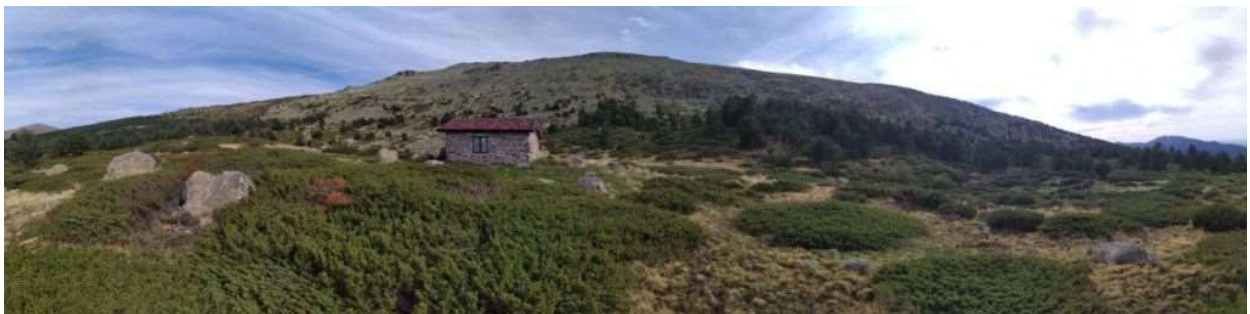
Panorámica de Peñalara con el Chozo Aranguez en primer plano

Si la ida nos puede costar 2:30h y la vuelta 2:00h, con las paradas que hagamos nos puede llevar 5:00h o un poco más.