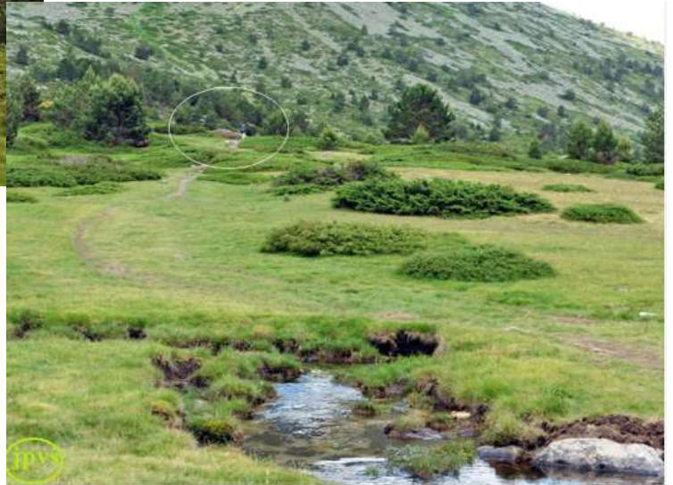
Arroyo Peñalara, al fondo el chozo Aranguez o cabaña del Pastor.

Pasamos sobre los múltiples regueros hasta llegar al Arroyo de Peñalara desde el que ya se ve el refugio del Chozo Aranguez.