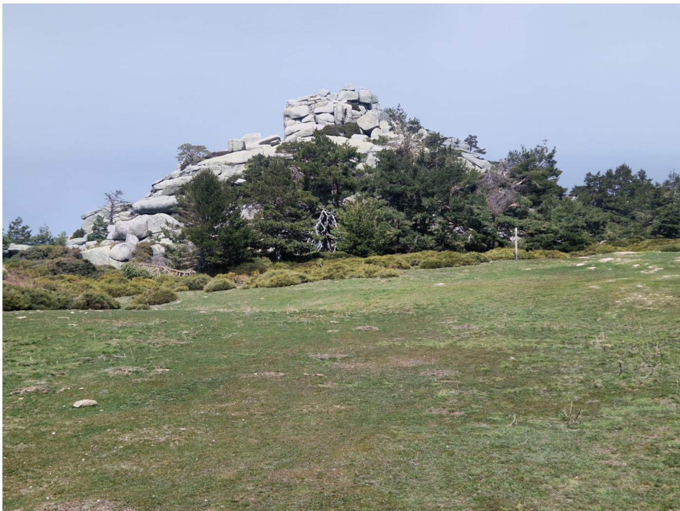
Pradera de Majalasca