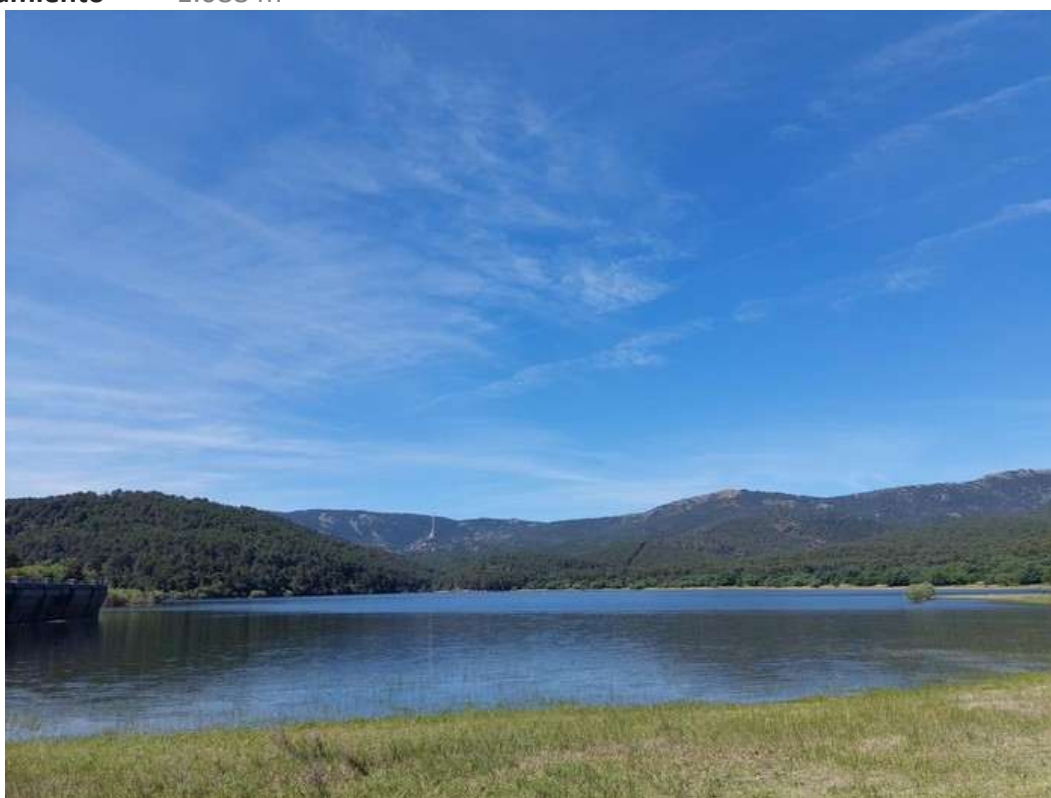
Aparcamiento 1.088 m