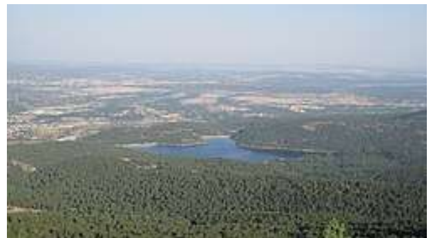
Vista general del embalse desde la ladera de Cabeza Líjar.

El embalse de la Jarosa fue construido en el año 1968, de manera acorde a la política económica franquista relativa a los embalses hidráulicos. Se emplazó en la aldea de la Herrería, despoblada dos siglos antes. Aún hoy en día es posible ver los restos de la torre de la ermita de San Macario, alojada en las praderas que rodean el pantano. Cuando el nivel del agua lo permite, se puede pasear entre los restos de las antiguas casas de la aldea que quedaron bajo las aguas del embalse.